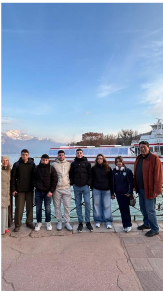
Στη λίμνη του Annecy