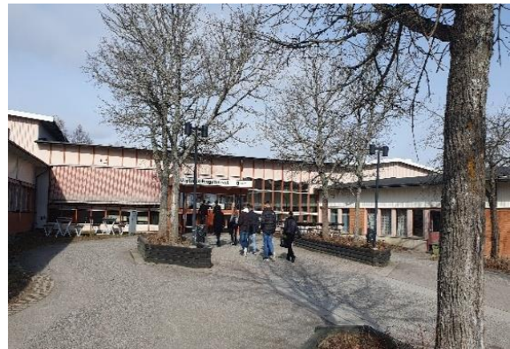
Το σχολικό συγκρότημα