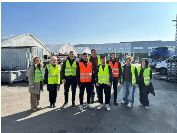
Στον χώρο ανακύκλωσης