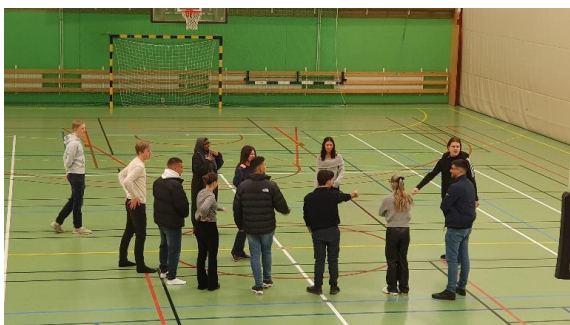
Στην πόλη της Στοκχόλμης