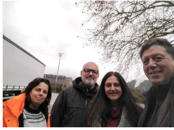
Με τους εκπαιδευτές οδήγησης