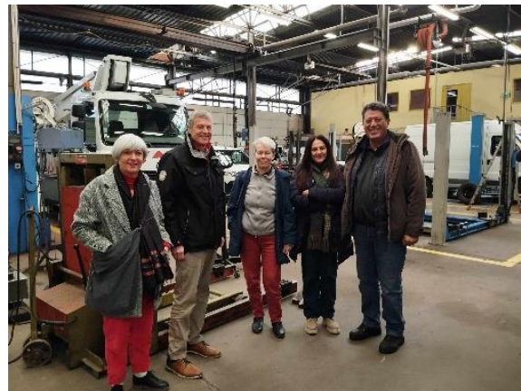
Τεχνικό Τμήμα Δήμου Chambéry

Από αυτήν τη συνεργασία διαπιστώθηκε ότι το γαλλικό σύστημα Επαγγελματικής Εκπαίδευσης μπορεί να αποτελέσει πρότυπο για το αντίστοιχο ελληνικό, με στόχο την προστασία της ζωής, την πρόοδο και τη φροντίδα του περιβάλλοντος.