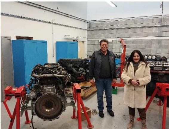
Τμήμα Μηχανικών Αυτοκινήτων, Lycée Louis Armand