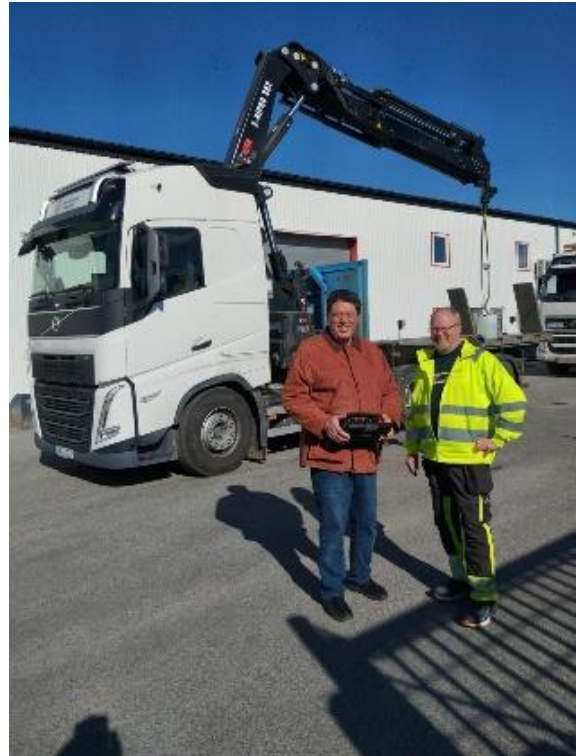
Εκπαιδευτής ηλεκτρικών ανυψωτικών

Από αυτήν τη συνεργασία διαπιστώθηκε ότι το σουηδικό σύστημα Επαγγελματικής Εκπαίδευσης μπορεί να αποτελέσει πρότυπο για το αντίστοιχο ελληνικό, με στόχο την προστασία της ζωής, την πρόοδο και τη φροντίδα του περιβάλλοντος.