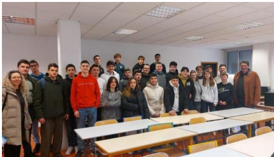
Μαθητές σε κοινές δραστηριότητες