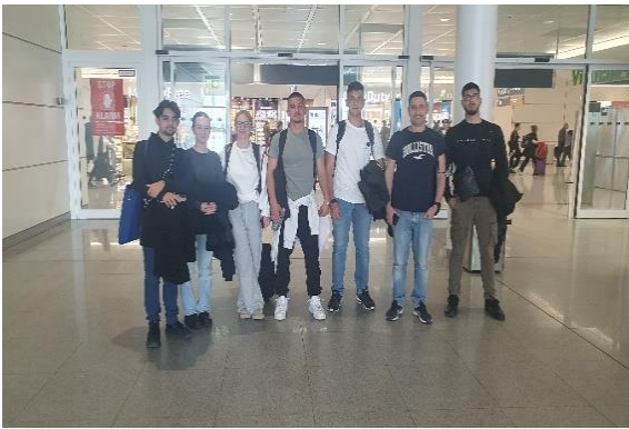
Άφιξη στο Upplands Brogymnasiet