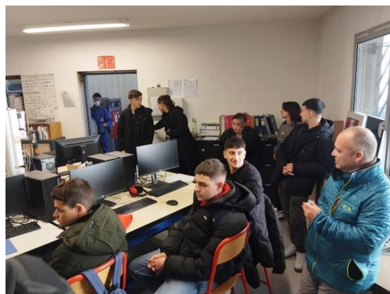
Εκπαίδευση στα εργαστήρια