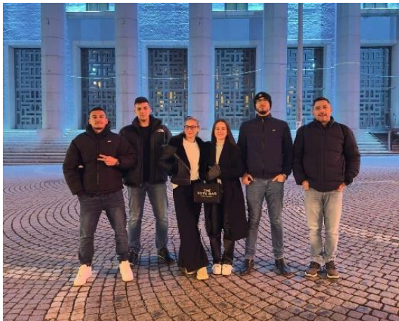
Εκπαίδευση στα εργαστήρια