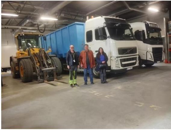
Χώρος εκπαίδευσης βαρέων οχημάτων