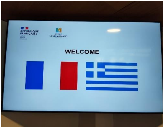
Άφιξη – Lycée Polyvalent Louis Armand