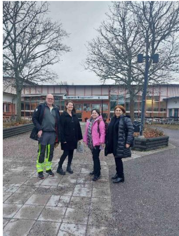
Με την Υπεύθυνη ERASMUS

Οι προπαρασκευαστικές επισκέψεις έθεσαν τις βάσεις για τη συνεργασία των σχολείων, με κοινό στόχο τον προγραμματισμό των κινητικότητας μαθητών και καθηγητών.