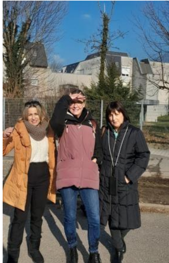
Με την Υπεύθυνη ERASMUS του σχολείου