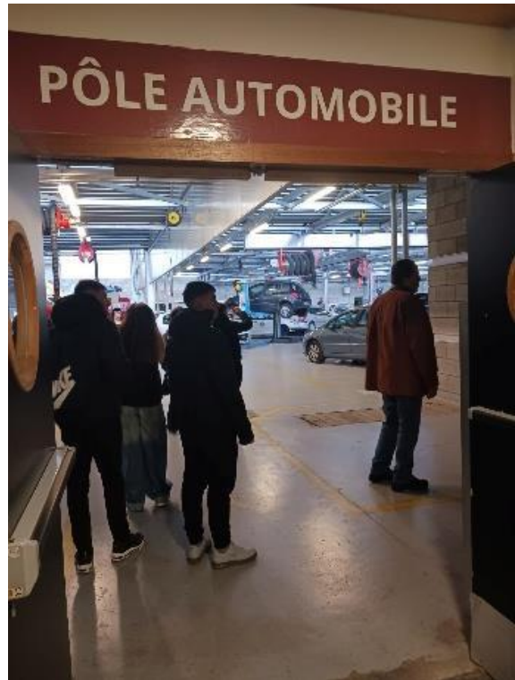
Pôle Automobile – εργαστήρια