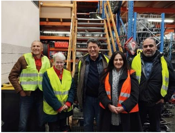
Ξενάγηση σε χώρο ανακύκλωσης αυτοκινήτων