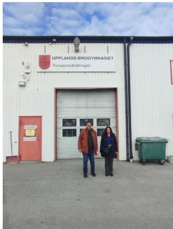
Εργαστήρια Τεχνικού Τμήματος